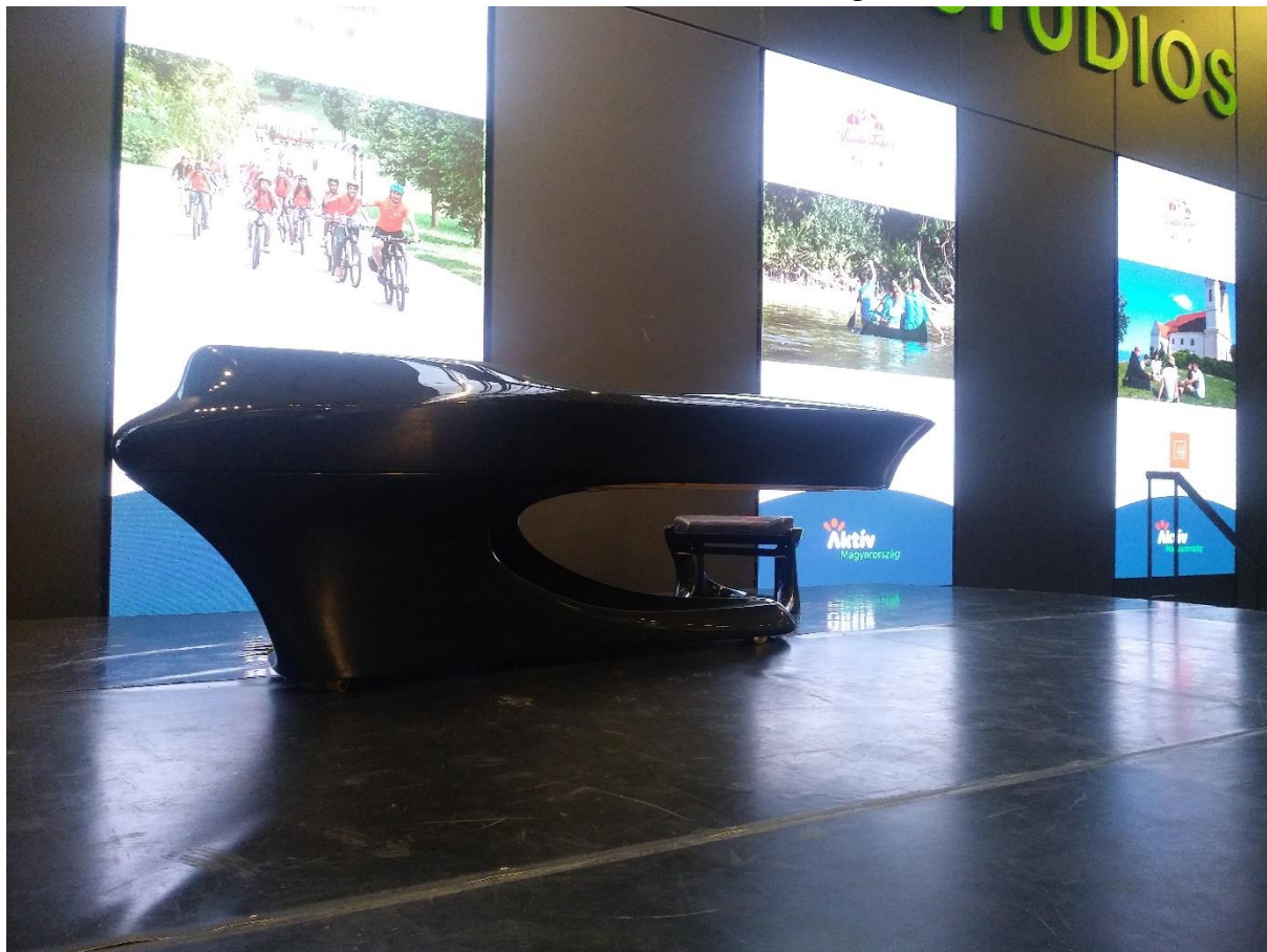
Egy futurisztikus Bogányi zongora a hallban.