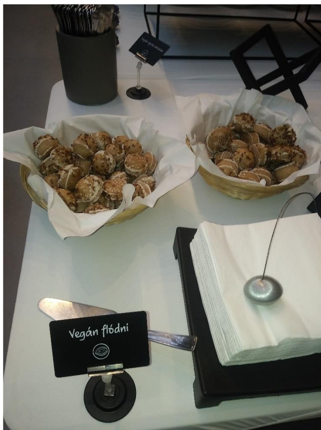
Mindenkire gondoltak a szervezők!